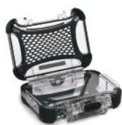
Ensemble de panneaux en Lexan