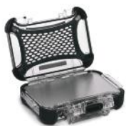
Ensemble de panneaux en aluminium