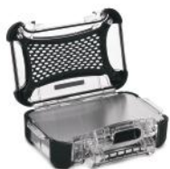
Ensemble de panneaux en aluminium