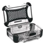
Ensemble de panneaux en Lexan