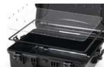
Ensemble de panneau étanche