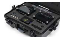
Mousse coupée sur mesure