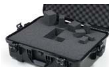
Calages de mousse cubique