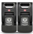
TSA Approved Latches Ferroirs à serrures TSA