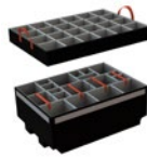
Padded Divider Séparateurs coussinés