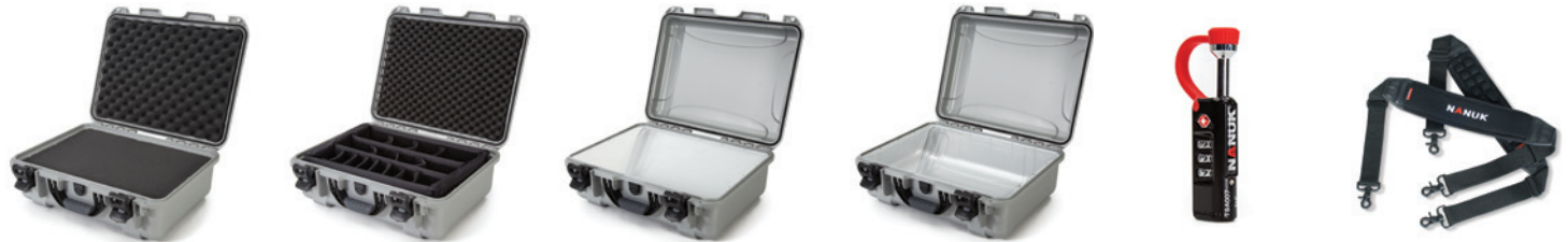
Multilayer Cubed Foam Mousse en cube multicouches