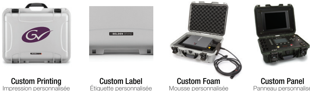
Custom Printing Impression personnalisée